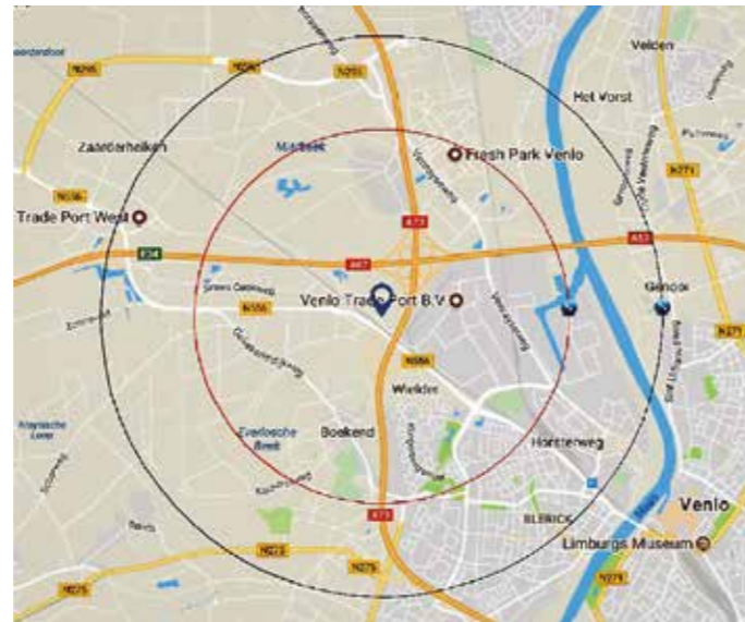
Cirkel 2 kilometer in rood, cirkel 3 kilometer in zwart

Op alle fronten wordt zéér in strijd gehandeld met een goede ruimtelijke ordening. Denk daarbij ook aan het feit dat de vijf windturbines richting Blerick buiten het voorkeursgebied liggen en voor het grootste deel gesitueerd zijn in de “goudgroene natuurzone”, het Limburgse deel van het “Nationaal Natuurnetwerk”, ter hoogte van verbindingzones. Tegenover het natuurgebied Crayelheide en het natuureservaat Koelbroek(!).