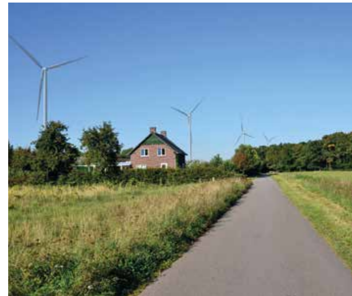
Visualisatie Heierkerkweg in Blerick. Achter deze woning komt op 400 meter afstand windmolen nummer 4. Daartussen liggen nog twee woningen.

Leefbaarheidsfonds Leudal ontvangt 300.000 euro voor de plaatsing van twee windmolens. Windpark Venlo geeft 500.000 euro uit voor de plaatsing van negen windmolens te verdelen over zeven buurten, waaronder Blerick, Boekend en Heierhoeve.